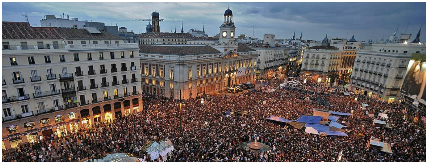
Espectacular imagen de la Puerta del Sol tomada por millares de indignados, una estampa que duró varias semanas.