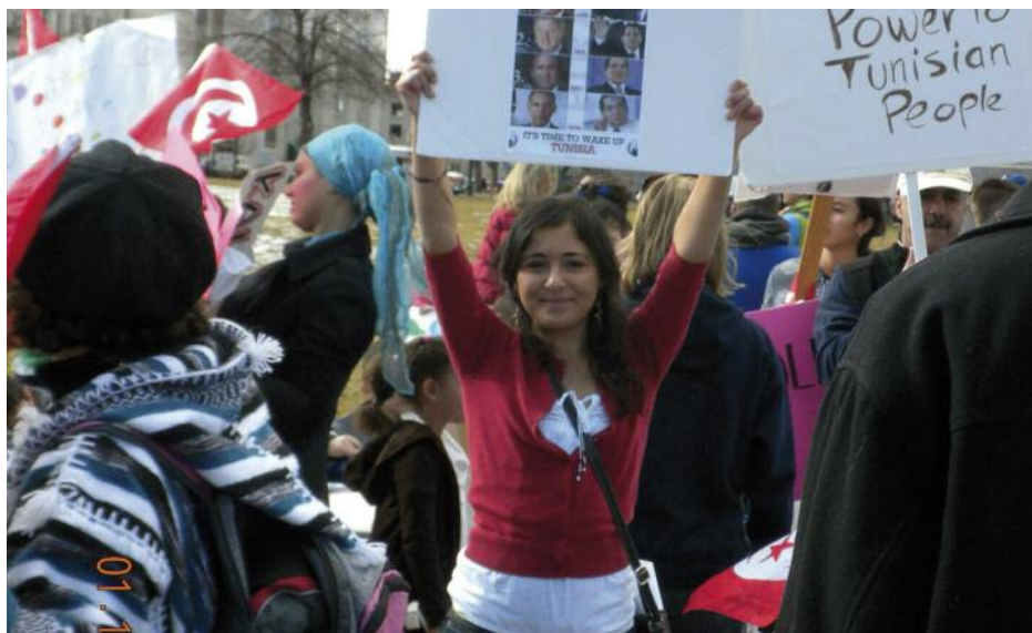
Jóvenes muestran su apoyo a las revueltas acontecidas en los últimos meses