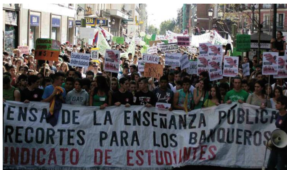
Manifestación contra los recortes en la educación pública el pasado mes de septiembre

(Coordinador de la Federación de Enseñanza de CCOO, zona Este)