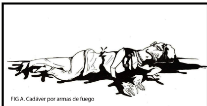
FIG A. Cadáver por armas de fuego